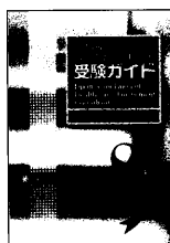
(左) 医業経営コンサルタント試験 受験ガイド